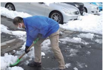
▲大雪にスコップを振る先輩の姿

アルバイトをはじめて 間もなく、2週間連続で このエリアに記録的な降 雪がありました。