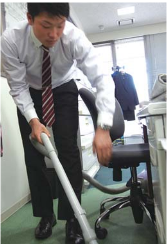
▲フロアの朝の掃除は新人の日課